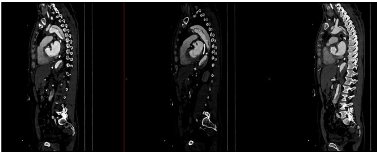
Figura 3: Angiografía aórtica torácica y abdominal que muestra una disección aórtica que involucra toda la aorta torácica y abdominal descendente, extendiéndose hasta el origen de la arteria ilíaca común.